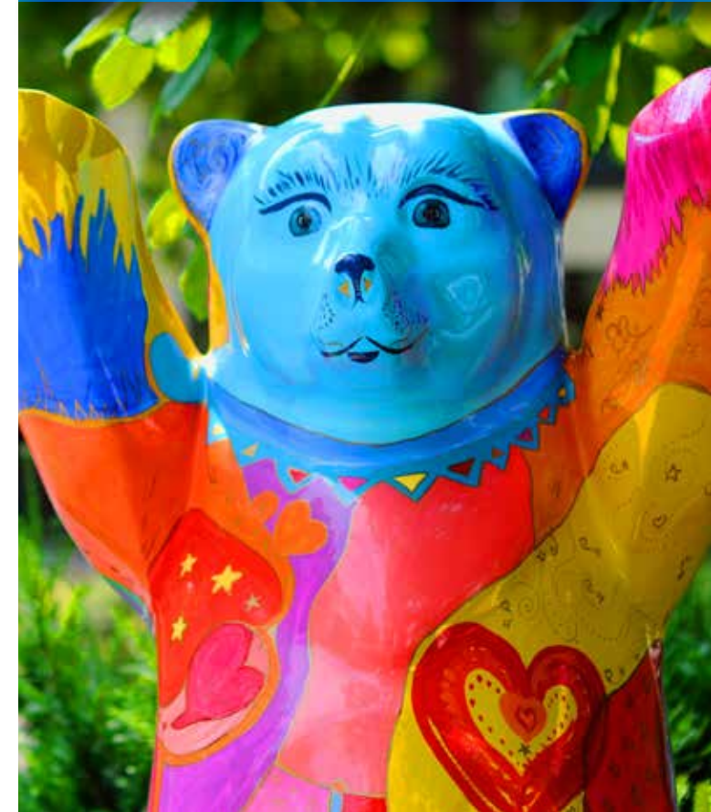
Design & Lagerplan | © Charité, CV | Fotos: Wiehke Peitz, Zentrale Medienserviceleistungen Charité Buddy Bär bemalt von Michaela Chakraborty-Pokorny, Campus Virchow-Klinikum, Charité - Universitätsmedizin Berlin | CCT (Pädm.S.PneumoImmu)